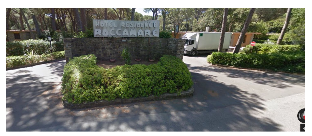
Roccamare main entrance